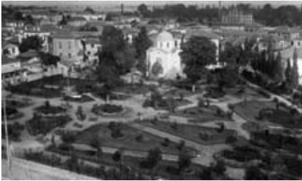
Εικ. 2. Ο ναός του Άγ. Βησσαρίωνος σε μεταγενέστερη μορφή, από επιστολικό δελτάριο του 1930 περίπου. Ο περιβάλλων χώρος έχει διαμορφωθεί σε πλούσια επιμελημένο πάρκο.