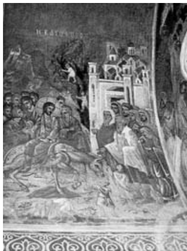
Εικ. 5. Ἡ Βαϊοφόρος. Τοιχογραφία τοῦ Ἀγίνου Ἀστεριάδη καὶ τῶν μαθητῶν του στὸν σημερινὸ ναὸ τοῦ Ἁγίου Βησσαρίωνος. 1961.

μικρὴ πισίνα, ἐνῶ οἱ δημοτικὲς ὑπηρεσίες εἶχαν διαμορφώσει ὁμορφα τὸν ὑπόλοιπο χῶρο μὲ ἄφθονες νησίδες πρασίνου.