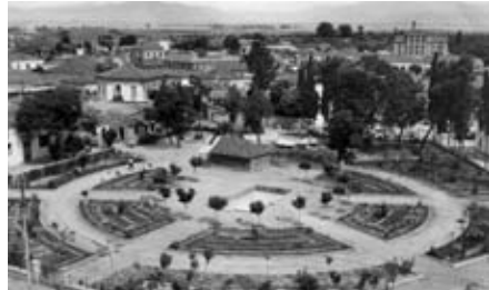
Εικ. 3. Η πρόχειρη παράγκα ή όποια αντικατέστησε προσωρινά τον κατεστραμμένο από τον σεισμό μικρό ναό του Άγ. Βησσαρίωνος. Φωτογραφία του Τάκη Γλούπα του 1950 από το ύψος του γειτονικού μναρέ του Γενί τζαμιού.

Τήν ἴδια χρονιά ὁ ἐστιάτορας Κωνσταντῖνος Γεωργ. Νατάκιας 14 , πού ἦταν συμπολίτης φιλόθρησκος καί φιλεύσπλαχνος, μέ δαπάνες του ἀνακαίνισε τό ἐκκλησάκι, κάλυψε μέ ἐπίχρισμα τούς ἐξωτερικούς τοίχους καί τήν κεραμοπλαστική διακόσμηση (Εἰκ. 2), ὀλοκλήρωσε τήν ἀγιογράφησή του καί ἐμπλούτισε τό ἐσωτερικό του μέ ἱερά σκεύη καί ἔπιπλα. Ἐτσι ὁ μικρός ναός τοῦ ἁγίου Βησσαρίωνος περιῆλθε στήν κατοχή τῶν Λαρισαίων καί ἀποδόθηκε στήν κοινή λατρεία τῶν πιστῶν τῆς περιοχῆς.