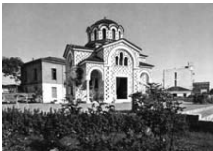
Εικ. 4. Ο σημερινός ναός του Ἁγ. Βησσαρίωνος στὴν ὁμώνυμη πλατεία, δίπλα ἀπὸ τὸ κτίριο τοῦ Δημοτικοῦ Ὡδείου, ὅπως τὸν ἐκτίσε ἡ εὐλάβεια τῶν διοικούντων τὸν ΟΥΗΛ. 1975 περίπτου.