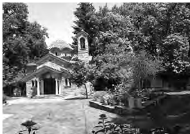
Ό Ι. Ναός αγίου Βαρνάβα στήν κατασκίνωση της ΓΕΧΑ.

ἀπαράμιλλης ἔμπνευσης καί ἐργατικότητας τοῦ μακαριστοῦ π. Ἰγνατίου Μαδενλίδη.