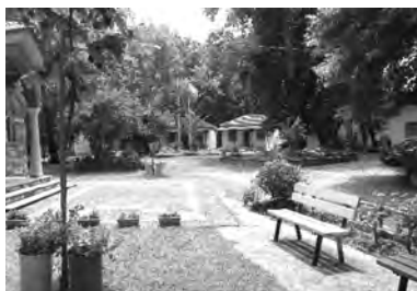
Κατασκίνωση της ΓΕΧΑ Λάρισας στήν παραλία Σκοτίνας Περίας.